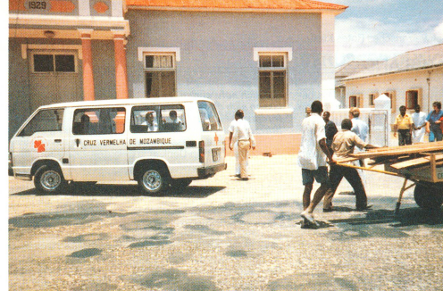
Ein Fahrzeug der Blutspendequeue des «Cruz Vermelha de Moçambique», des Mozambikanischen Roten Kreuzes. Es wurde vor über einem Jahr vom Schweizerischen Roten Kreuz geliefert.

Das Blutspendewesen in Drittweltländern – zum Beispiel Mozambique