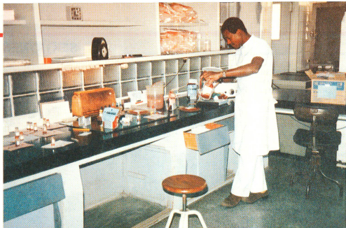
Labor des nationalen Blutspendezentrums in Maputo.