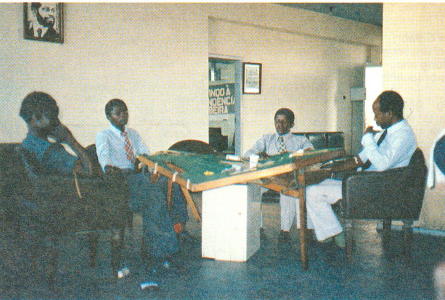
Es geht auch so: In einem Industriebetrieb in Beira dient ein alter Spieltisch als Abstellfläche für die Blutentnahme.