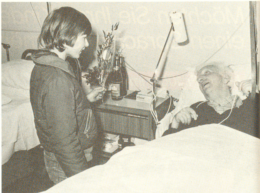
Seit Jahren überreichen Freiwillige des Roten Kreuzes am Tag der Kranken Langzeitpatienten in Spitälern und Heimen Blumen. Am vergangenen 6. März waren es 30 000 Sträuße. Mit der Blumenaktion möchten das SRK und seine 69 regionalen Sektionen andere ermuntern, selbst Kranke zu besuchen, nicht nur am ersten Märzsonntag, sondern während des ganzen Jahres.

Auf der Intensivstation eines Spitals liegen Patienten, die vielleicht noch am Vortag ihren Alltagsbeschäftigungen nachgingen. Zum Beispiel B., ein 20jähriger Mann, und seine Freundin: Sie hatten einen schweren Motorradunfall. Die Ärzte mussten B. ein Bein amputieren. B. spielte halbprofessionell Fussball. Nachdem er