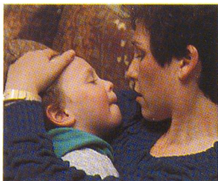
Die dramatische Geschichte des kleinen Micky. Seite 46.