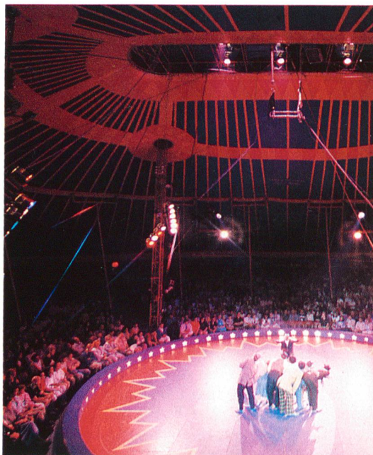
THE IMAGE BANK

für Leute geben, die vielleicht noch nie in ihrem Leben irgend etwas gesehen hatten. Dennoch galt es, so konkret wie möglich zu rapportieren. Der Reporter fragte zum Beispiel an, ob er die Hose eines Entertainers als «weiss wie Schnee» beschreiben könne. «Ja», antwortete die Leiterin der Blindenschule, «sie wissen, dass Schnee weiss ist.»