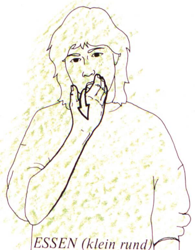
ESSEN (klein rund)