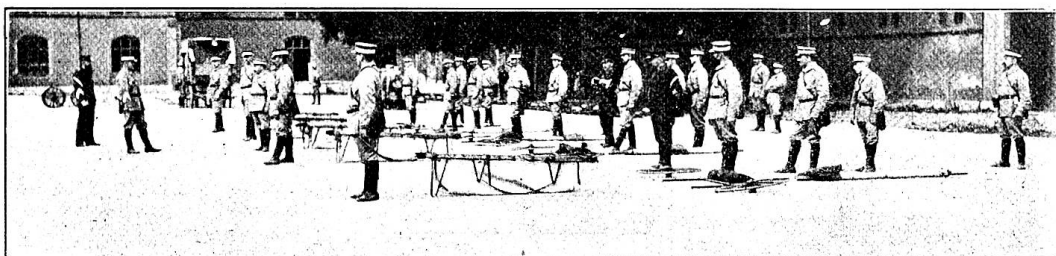
Exercices pratiques au moyen du brancard démontable.