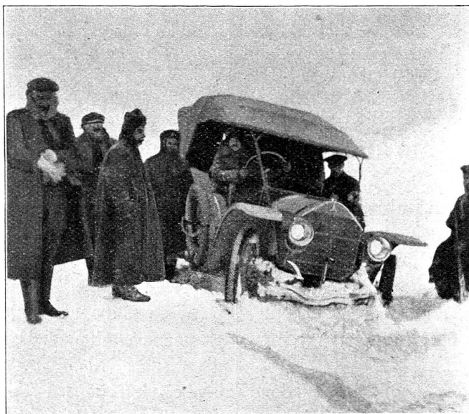
En route vers Demotica. — Notre automobile en panne dans la neige

Une autre chose à noter est la prédominance des blessures du côté gauche,