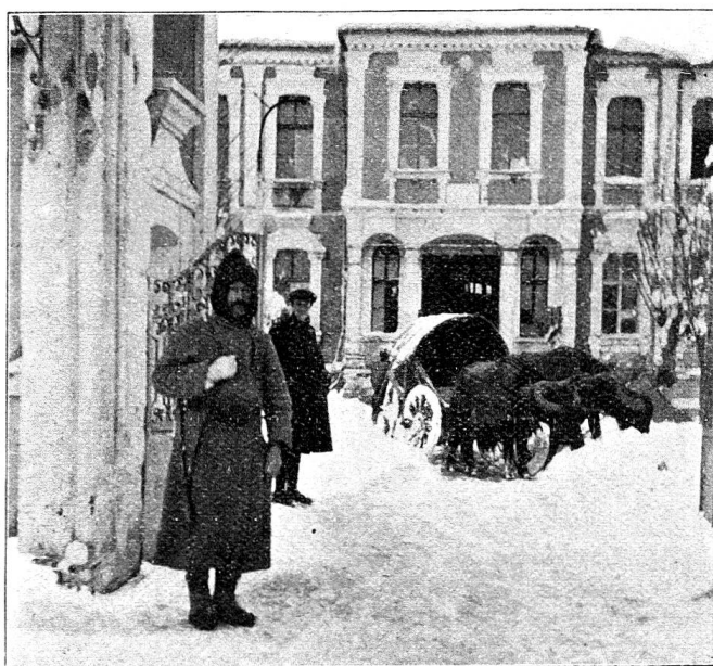
Le tribunal turc à Demotica où nous avons installé notre hôpital. Un des chars à buffles qui nous ont amené nos nombreux bagages

C'est à Kirkilissé que j'ai vu le modèle de l'hôpital de campagne. Il avait été installé par une mission russe qui avait fait la campagne de Mandhourie et en