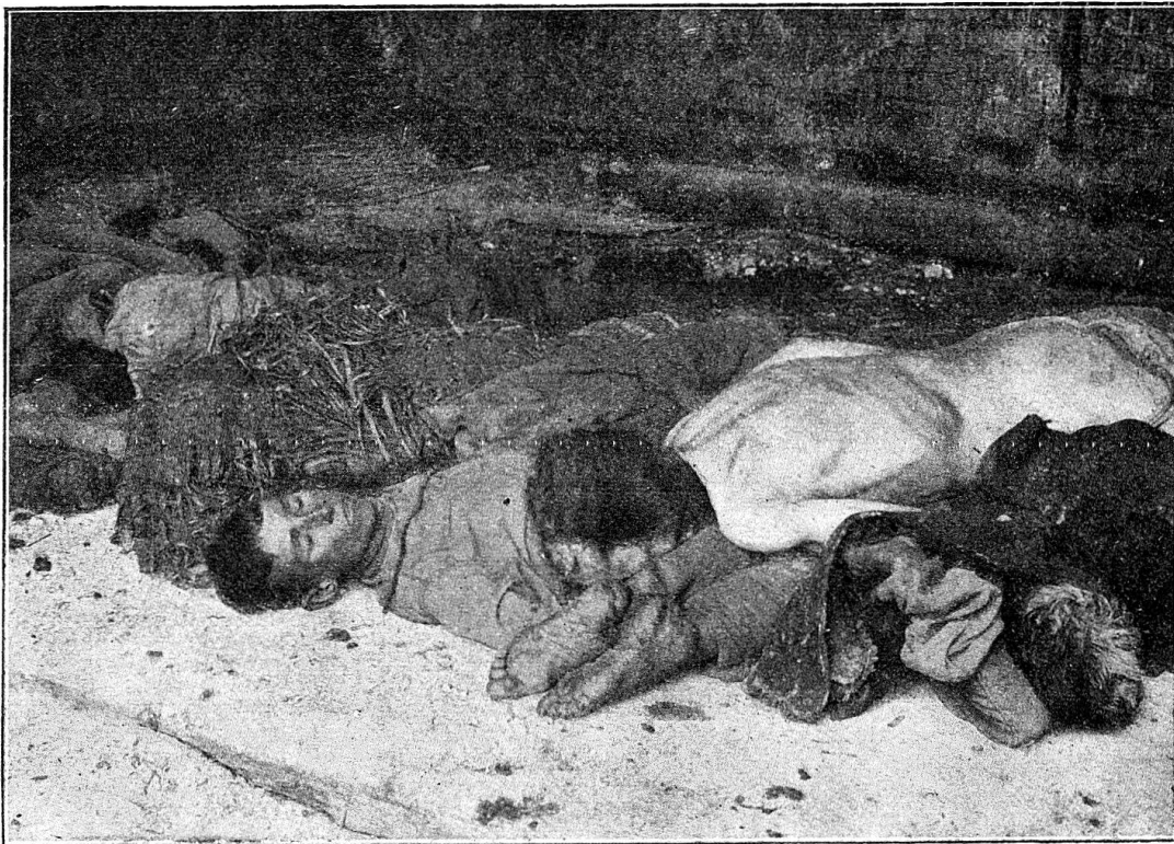
A Orenburg, cadavres abandonnés sur les routes et dans les campagnes.

Nous avons vu au cimetière un tas de 60 à 70 corps qui attendaient d'être jetés dans une fosse. C'était la récolte de deux jours, sans compter les morts enterrés directement par leurs proches. Nous avons vu aussi une fosse pleine de cadavres. Nous avons vu, couchée dans la rue principale, un corps de femme déjà rongé par les chiens (les gens commencent à avoir peur des chiens) . Copeman, des « Friends », nous a dit qu'il sortait rarement de chez