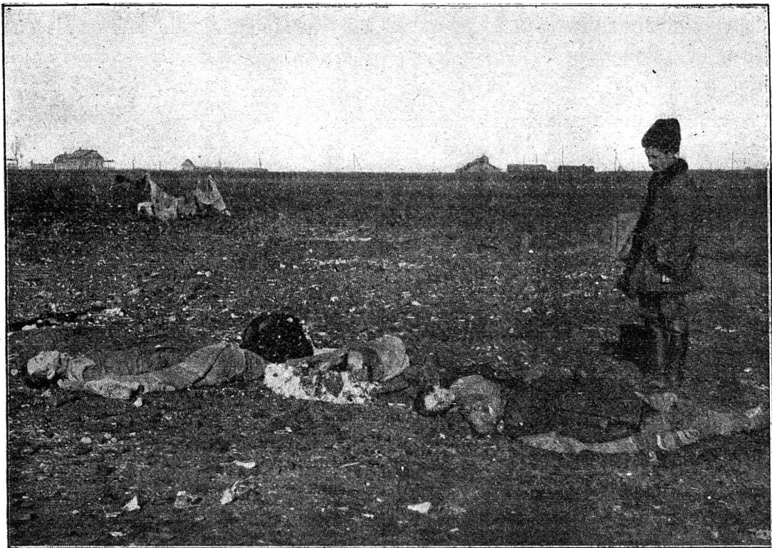
Le victimes de la famine russe.

Depuis que j'ai commencé cette lettre, je suis allé avec Nansen dans le district de Samara, où la situation est pire encore qu'à Saratov, malgré le très bon travail effectué par l'A. R. A. à Samara et par les « Friends » à Bouzoulouk. Dans les villages voisins de Samara, nous avons vu beaucoup de gens couchés dans leurs maisons et, toutes leurs provisions étant épuisées, attendant la mort. Je vous en-