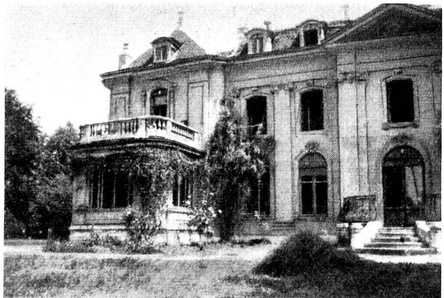
La Grande-Boissière, à Genève, où ont lieu les cours internationaux de moniteurs.