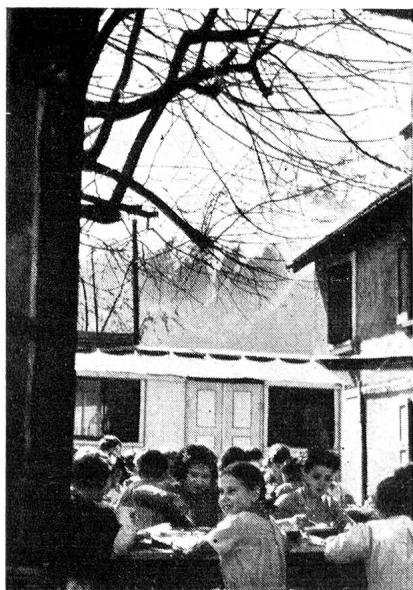
Avec la «République de Moulin-Vieux» dans les Alpes

Souhaitons que le monde n'ait pas bientôt à constater, avec une profonde tristesse, que même sur le plan de l'action humanitaire un nouveau Rideau de fer s'est dressé, plus tragiquement significatif encore que le premier du schisme qui sépare l'Est de l'Occident.