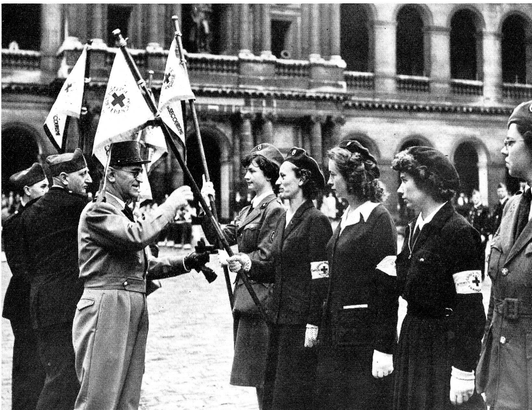
A l'occasion du congrès des secouristes français à Paris, une émouvante prise d'armes eut lieu aux Invalides, au cours de laquelle le Médecin-Général Hugonnot, Inspecteur général du Service de santé militaire, remit des fanions et des décorations.