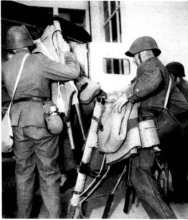
Les soldats de la Croix-Rouge chargent le matériel sanitaire dans les camions militaires.

coulait en abondance, celui-là avait les deux bras brisés, et un autre encore montrait sa jambe ouverte où l'os apparaissait à nu!