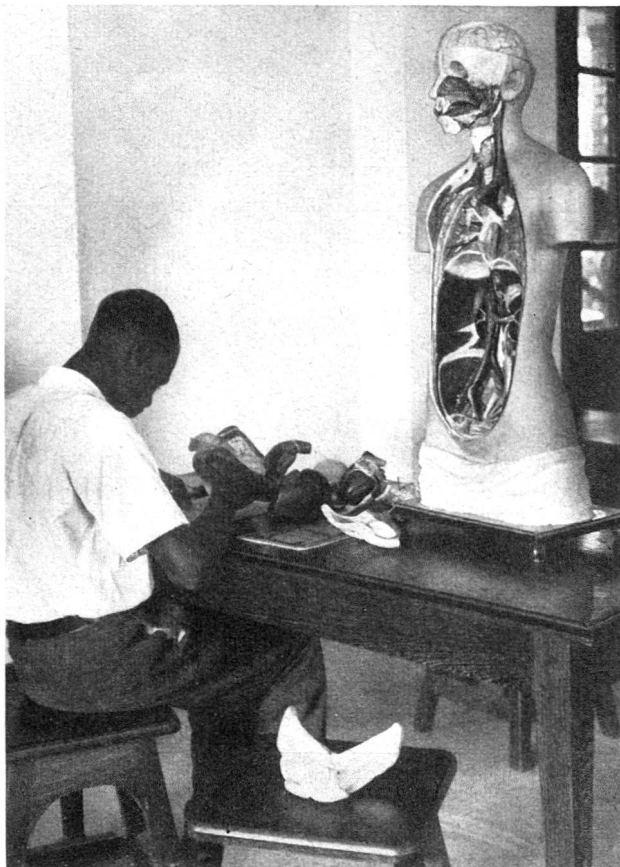
Une école d'Etat forme à Léopoldville de nombreux assistants médicaux indigènes.