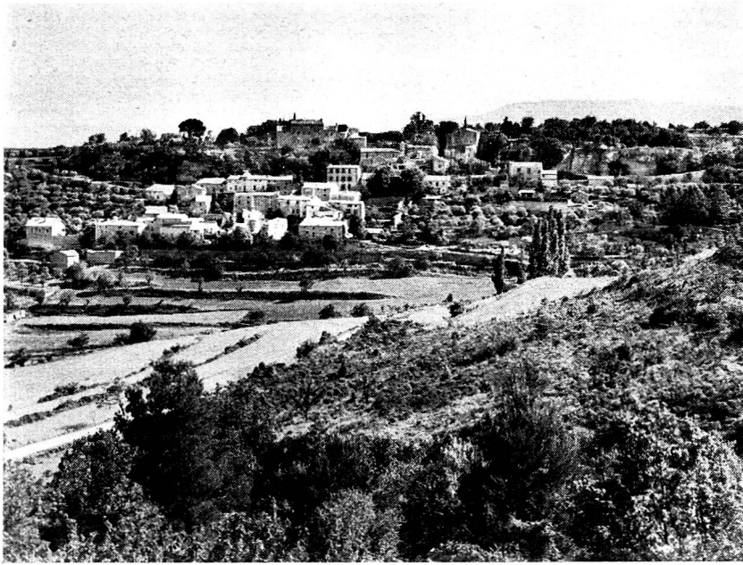
La Roque-sur-Pernes (Vaucluse) où trente Banatais ont déjà pu trouver un nouveau foyer et des terres à cultiver.

l'Occident ont quitté ce qui était devenu leur nouvelle patrie, et sont venus chercher refuge en France: ils sont maintenant quarante mille, groupés aux alentours de Colmar, dans une installation fort précaire, tandis que trente mille autres Banatais attendent dans des camps des zones occidentales d'Allemagne et d'Autriche de pouvoir venir se fixer en France. Mais ce à quoi aspirent ces agriculteurs qui, en quelques décades dans un pays totalement étranger, avaient réussi à transformer des marécages en grenier à blé, c'est à un établissement durable, c'est à replonger de profondes racines, et dans le sol de France.