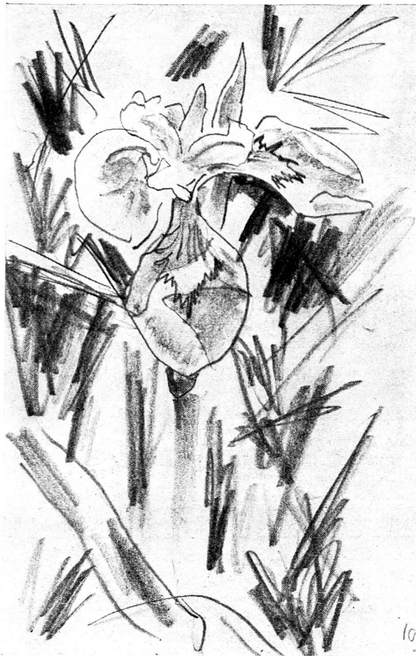
Iris jaune des marais (dessins de Robert Hainard).

Pattes démesurées, grands becs arqués, retroussés, aplatis. Vastes ailes, ailes en faux. Vols amples, crochetants. Grands yeux rouges ou dorés, petits yeux noirs. Bigarrures violentes, plumages chinés de tons subtils. Grands hérons décharnés, canards replets, en peu de lieux la diversité de la nature est plus frappante. Si riche en vie, si inutile à l'homme, et même un peu hostile avec ses moustiques, ses fouillis harassants, ses herbes coupantes, ses profondeurs traîtresses, le marais est détruit sans pitié par notre civilisation, qui n'admire qu'elle-même. Pour combien d'entre nous ne représente-t-il pas le besoin passionné d'aimer les formes de vie qui échappent à notre emprise, et par là, sont capables de nous renouveler, de nous enrichir indéfiniment.