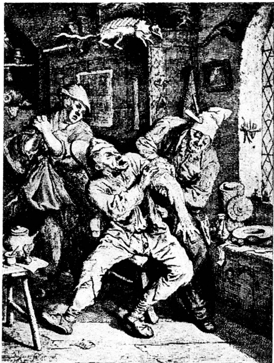
Le Chirurgien, eau forte de Cornelius Dusart.

Devant un tel raffinement dans l'art d'«endormir» son prochain, on a de la peine à imaginer ce qu'était une opération chirurgicale avant l'application de l'anesthésie: le patient ligoté, hurlant de douleur, suppliant qu'on le laissât mourir plutôt que de prolonger son martyre, tandis que le scalpel tranchait à vif dans les chairs... Il y a une centaine d'années encore, on ne connaissait qu'un seul narcotique: l'alcool. A l'exemple d'Esculape, fils d'Apollon qui — si