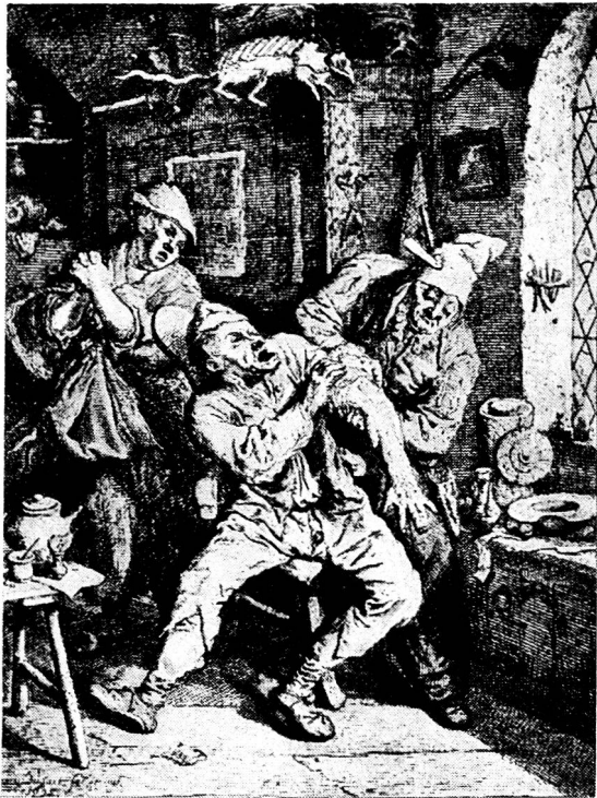
Le Chirurgien, eau forte de Cornelius Dusart.

Devant un tel raffinement dans l'art d'«endormir» son prochain, on a de la peine à imaginer ce qu'était une opération chirurgicale avant l'application de l'anesthésie: le patient ligoté, hurlant de douleur, suppliant qu'on le laissât mourir plutôt que de prolonger son martyre, tandis que le scalpel tranchait à vif dans les chairs... Il y a une centaine d'années encore, on ne connaissait qu'un seul narcotique: l'alcool. A l'exemple d'Esculape, fils d'Apollon qui — si