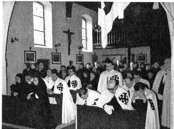
L'investiture, le 3 février dernier, de deux dames et de six chevaliers de l'Ordre du Saint-Sépulcre dans l'église de Confignon (Genève).

«Dans l'histoire millénaire de cet ordre, écrit le cardinal Canali — premier grand-maître de l'Ordre nommé par le pape Pie XII — les fastes de la religion s'unissent aux trophées de la chevalerie chrétienne; le culte et la défense du tombeau de Notre Seigneur Jésus-Christ se révèlent inséparables de la fidélité à l'Eglise et au Pontife romain, au point de créer une double tradition palestinienne et romaine qui fait la gloire de cet Ordre, devant les siècles et les peuples chrétiens.»