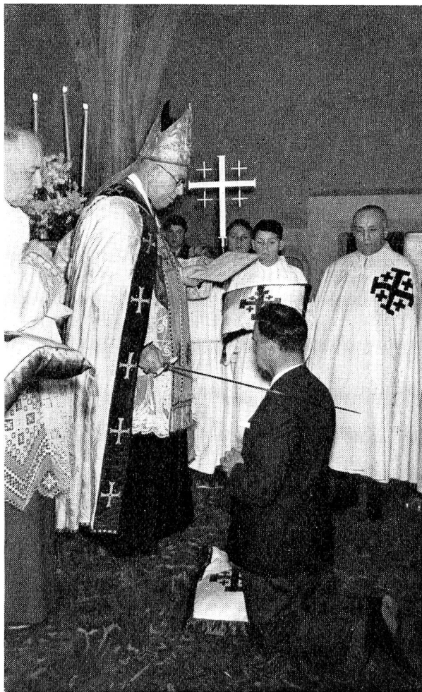
L'adoubement d'un nouveau chevalier par Mgr. Charrière, évêque de Lausanne, Genève et Fribourg. (Confignon, février 1952.) L'insigne rouge de l'ordre est porté sur un manteau blanc pour les chevaliers et noir pour les dames.

C'est par le bref apostolique « Quam Romani Pontifices » que le pape Pie XII a donné un nouveau statut à l'Ordre du Saint-Sépulcre: « L'idéal des croisades survit, dit-il, dans une forme moderne, par l'esprit de foi, d'apostolat et de charité chrétiennes ». D'après les directives contenues dans ce bref, l'Ordre s'étend de nouveau à tout le monde chrétien, et en Suisse même, comme il y a quelques mois à Hauterive, à Einsiedeln ou à Genève, il a été procédé à l'investiture de nouveaux chevaliers dont l'idéal se manifeste par l'exemple chevaleresque et chrétien dans la vie familiale, sociale et professionnelle, envers les pauvres, les faibles et les persécutés, et dans leur lutte pour les droits de Dieu et de son Eglise. Sélignac † H. C. H.