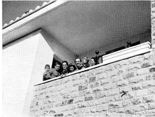
Grâce à de généreux appuis, la famille a trouvé un vrai foyer, neuf et confortable, au village de Saint-François.

chrétienne de tout le monde, et sous toutes les formes imaginables. Aux producteurs, par exemple, on demande de fournir bénévolement des matériaux de construction: bois, fer, ciment, briques, plomb, etc. Aux artisans de donner leur main-d'œuvre. Aux autres une obole, quelle qu'elle soit, selon que chacun peut. Grâce à tous ces bienfaits apports l'on pourra peu à peu agrandir le village et y accueillir un nombre toujours plus grand de ces déshérités, les sauvant ainsi, sous la protection de Saint François patron et parrain du village, de la pire déchéance. Car la maison est le plus grand don que l'on puisse recevoir de la Providence, le don matériel qui mieux que tout autre est une aide et un réconfort à l'homme dans sa lutte pour l'existence.