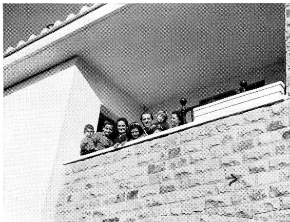
Grâce à de généreux appuis, la famille a trouvé un vrai foyer, neuf et confortable, au village de Saint-François.

chrétienne de tout le monde, et sous toutes les formes imaginables. Aux producteurs, par exemple, on demande de fournir bénévolement des matériaux de construction: bois, fer, ciment, briques, plomb, etc. Aux artisans de donner leur main-d'œuvre. Aux autres une obole, quelle qu'elle soit, selon que chacun peut. Grâce à tous ces bienfaits apports l'on pourra peu à peu agrandir le village et y accueillir un nombre toujours plus grand de ces déshérités, les sauvant ainsi, sous la protection de Saint François patron et parrain du village, de la pire déchéance. Car la maison est le plus grand don que l'on puisse recevoir de la Providence, le don matériel qui mieux que tout autre est une aide et un réconfort à l'homme dans sa lutte pour l'existence.