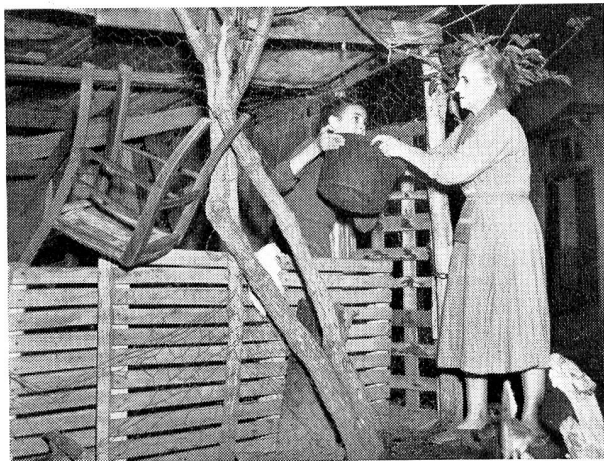
On va abandonner le taudis qui servait d'abri à la famille. N'oublions surtout rien!

L'initiative de cette entreprise revient à un petit groupe de particuliers aussi dévoués que désintéressés auxquels s'ajoutèrent, tout aussi