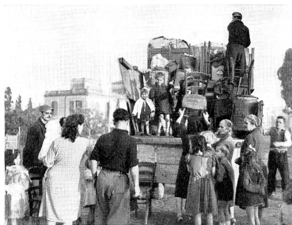
Enfants et bagages s'entassent sur le camion. En route vers le nouveau logis!

Le plan du village est simple, mais il est rationnel. Au centre, donnant sur une place, entourée de magasins, sera bâtie, aux frais du Vicariat, l'église du nouveau village. A côté un marché couvert trouvera sa place. On érigea l'école au milieu d'un jardin. Dans les rues desservant les différents quartiers commencent à s'ouvrir les premières boutiques. On a prévu