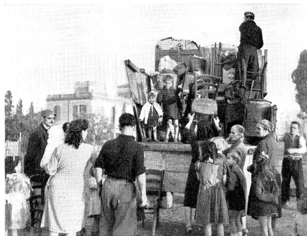
Enfants et bagages s'entassent sur le camion. En route vers le nouveau logis!

Le plan du village est simple, mais il est rationnel. Au centre, donnant sur une place, entourée de magasins, sera bâtie, aux frais du Vicariat, l'église du nouveau village. A côté un marché couvert trouvera sa place. On érigera l'école au milieu d'un jardin. Dans les rues desservant les différents quartiers commencent à s'ouvrir les premières boutiques. On a prévu