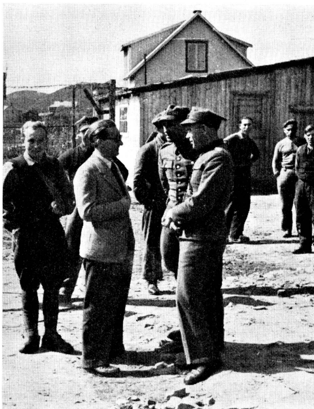
Un délégué du C. I. C. R. visitant un camp de prisonniers polonais en Norvège sous le cercle polaire pendant la guerre de 1939-1945.

En résumé, les Conventions protègent donc deux catégories principales de personnes: d'une part les ressortissants ennemis sur le territoire de chaque partie au conflit, et d'autre part l'ensemble de la population des territoires occupés.