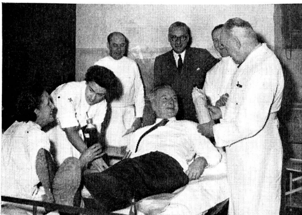
Lors de la prise de sang qui a eu lieu à Genève le 26 novembre, un des donateurs volontaires se vit fêté à sa grande surprise: on venait d'effectuer sur lui la 10 000 e prise de sang de l'année!