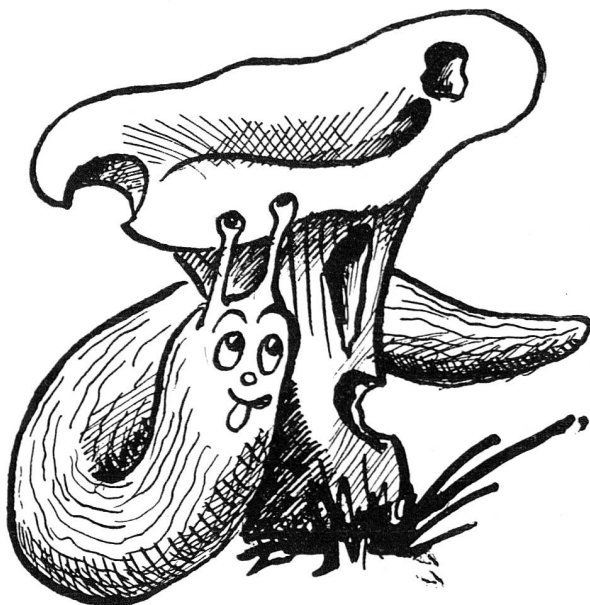
La limace ne s'attaque pas aux champignons vénéneux? Ce n'est pas vrai! Les pires amanites sont inoffensives pour la limace, qui s'en régale, et ne touche guère à la chanterelle trop coriace pour elle.

L'importance de la détermination exacte des champignons nocifs est donc très grande pour leur cueillette. Elle ne l'est pas moins pour le médecin appelé à traiter un cas d'empoisonnement. Car le diagnostic, et le traitement, seront fort différents selon le champignon qui aura provoqué l'accident. C'est pourquoi d'ailleurs, en cas d'empoisonnement par les champignons, il est toujours recommandé de retrouver et de mettre soigneusement de côté les épluchures ou le reste des champignons consommés pour les soumettre au médecin.