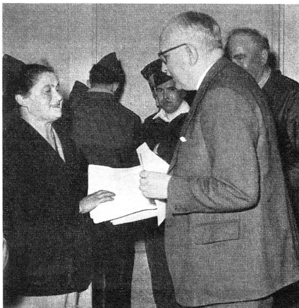
M. de Salis, ministre de Suisse à Paris, interroge une sinistrée de Villeneuve-Saint-George.

Le Conseil fédéral avait remis, comme nous l'avons signalé, à la Croix-Rouge suisse une somme de 50 000 francs pour le financement d'une action de secours en faveur des victimes des inondations en France. En accord avec la Légation de Suisse de Paris et les organismes français de secours, la Croix-Rouge suisse a utilisé cette somme à l'achat de literie. 4500 mètres de toile à matelas, 1000 couvertures et 1200 draps de lit ont été expédiés à la Croix-Rouge française.