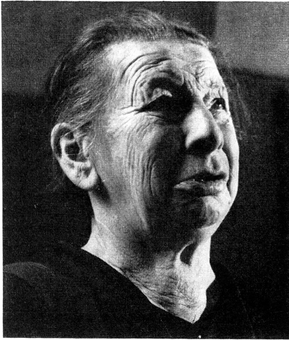
Nos sections romandes organiseront-elles aussi l'aide aux vieillards isolés?