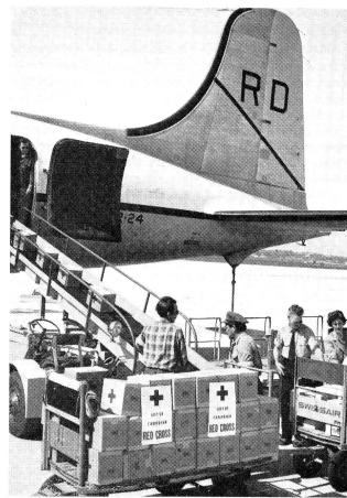
De l'aéroport de Cointrin, des secours de la Croix-Rouge ont été envoyés immédiatement en Grèce.

Le Comité central a voté un crédit de fr. 5700 pour l'achat de 100 matelas et un crédit de fr. 4000 pour du matériel destiné aux cours samaritains.