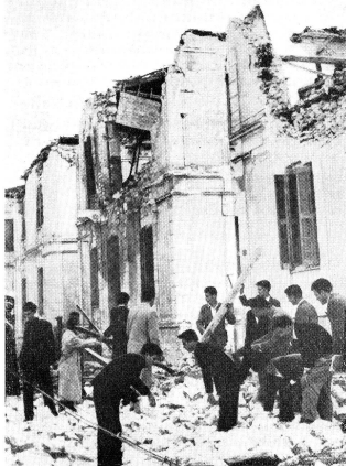
La catastrophe de Volos où un tremblement de terre a détruit cette ville de 70 000 habitants.