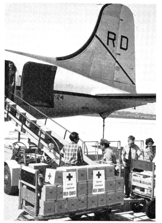
De l'aéroport de Cointrin, des secours de la Croix-Rouge ont été envoyés immédiatement en Grèce.

Le Comité central a voté un crédit de fr. 5700 pour l'achat de 100 matelas et un crédit de fr. 4000 pour du matériel destiné aux cours samaritains.