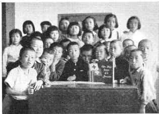
Une classe japonaise vient de recevoir l'album envoyé par l'école de Thierrens. Ils se font photographier à l'intention de leurs petits camarades vaudois.