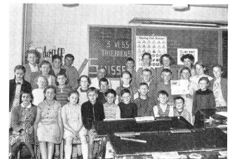
Et les juniors de Thierrens font de même, groupés autour de l'album qu'ils ont reçu du Japon en réponse au leur.

(Cf. La Croix-Rouge suisse, 15 avril 1955.)