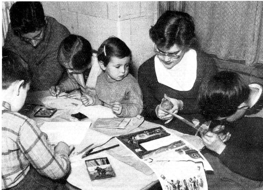
A la garderie d'enfants organisée en décembre par des « juniors » neuchâtelois.

sins malades, faire le ménage d'un infirme. De nombreux albums, confectionnés à la maison, ont été adressés à l'étranger. En retour, nous en avons reçu d'autres qui venaient avec bonheur illustrer nos leçons de géographie. Pour Noël, les enfants ont confectionné de petits paquets pour un asile de vieillards; ils sont allés, par petits groupes, chanter chez les isolés, autour d'une branche de sapin illuminée. Pour couvrir les frais, on a élevé des lapins qui se vendent fort bien. D'ailleurs, les frais de correspondance ont considérablement baissé depuis notre adhésion à la Croix-Rouge de la Jeunesse, puisque nos