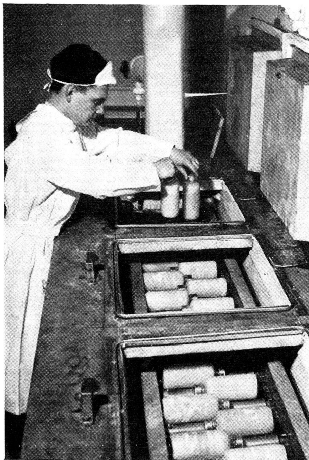
Au Laboratoire central: Les flacons de plasma sont placés dans un bain réfrigérateur.

Cette tâche est considérable. Pour s'en représenter l'importance, il faut songer que pendant la guerre de Corée les troupes de l'ONU ont utilisé en moyenne, par blessé grave, un