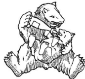
Marque à l'Ours