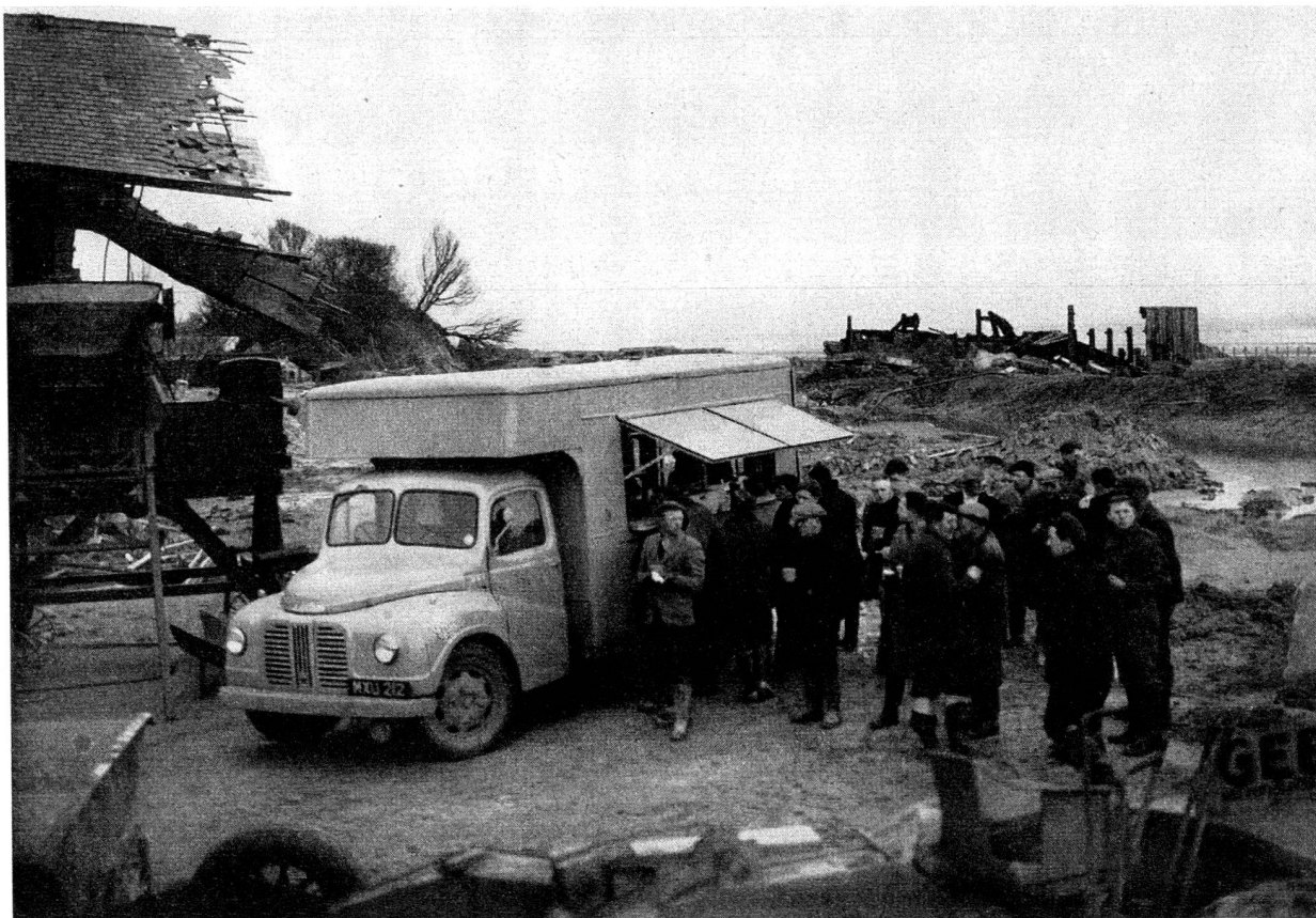
Cantine ambulante d'une colonne volante de ravitaillement servant des repas aux sinistrés de Sutton-on-Sea lors des inondations de février 1953.

fourgon pour le personnel) ainsi que 5 motocyclettes pour les liaisons furent créées pour porter secours aux populations des cités bombardées. Ces unités servirent également sur le continent à la fin de la guerre. Elles permettaient de préparer et de servir des repas chauds — 160 rations d'1/2 litre environ par chaudière, 14 chaudières par colonne, soit environ 2200 rations.