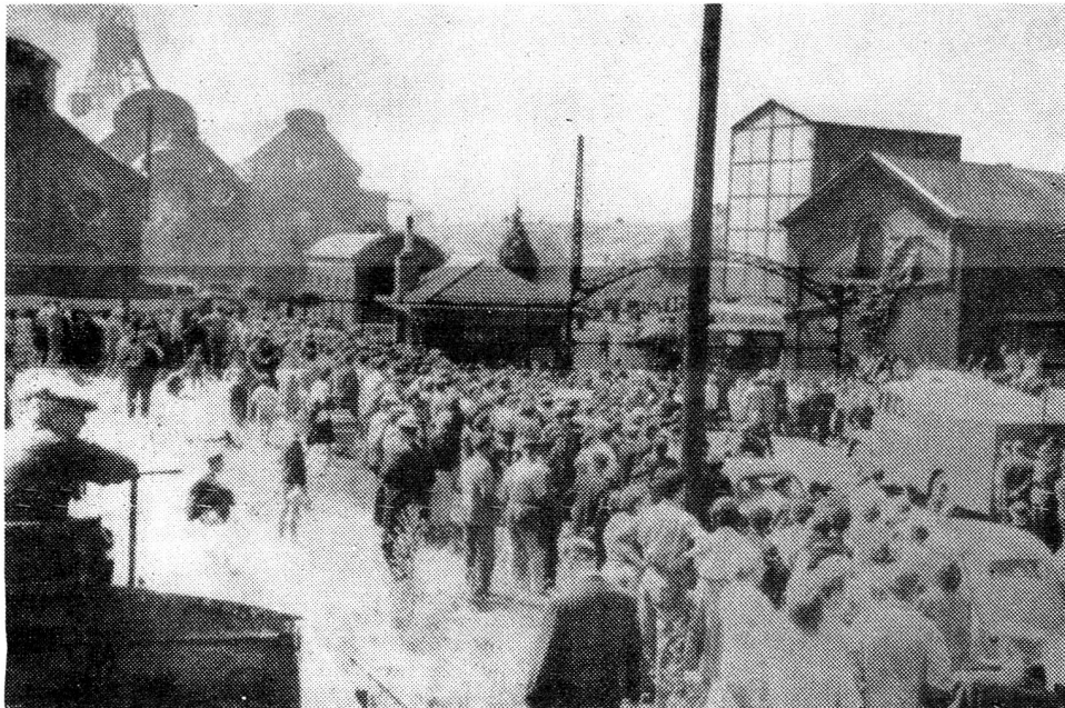
La catastrophe de Marcinelle, devant l'entrée de la mine.

A la suite des graves inondations qui ont ravagé l'Iran, la Ligue des sociétés de la Croix-Rouge avait lancé, le 3 août, un appel international en faveur des sinistrés.