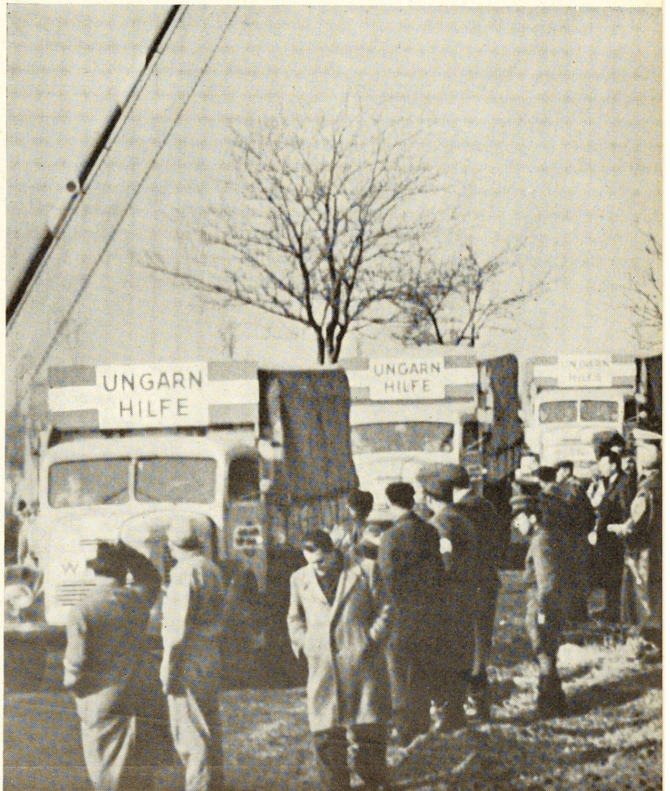
Les premiers secours de la Croix-Rouge franchissent la frontière austro-hongroise.

Le camp de vacances de Vaumarcus pour enfants diabétiques