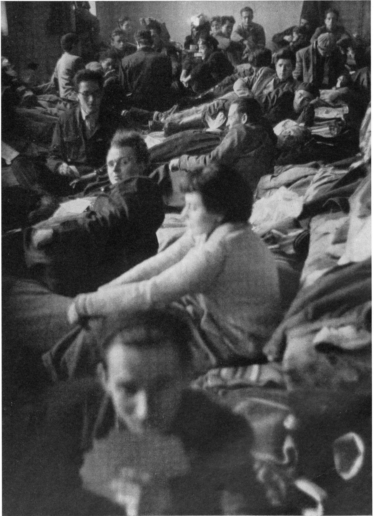
Un des camps provisoires d'accueil en Autriche où ont été accueillis plus de cent mille réfugiés hongrois.