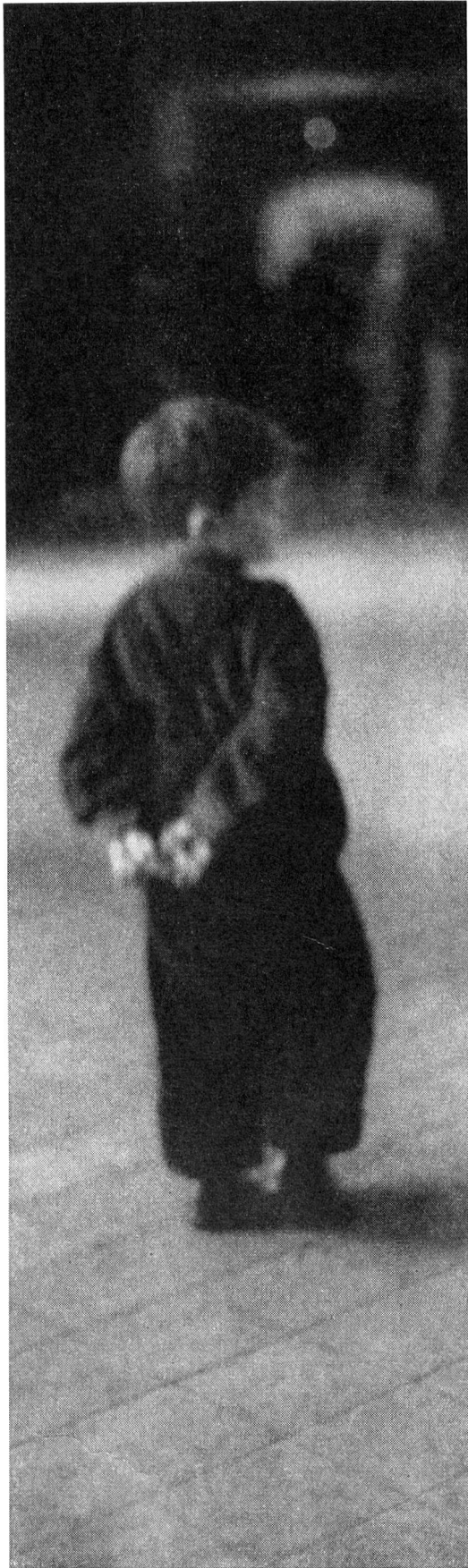
Dans un camp en Autriche, un petit réfugié hongrois...