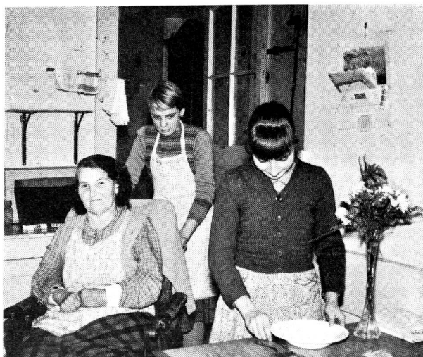
D'autres « juniors » vaudois font le ménage d'une voisine infirme.