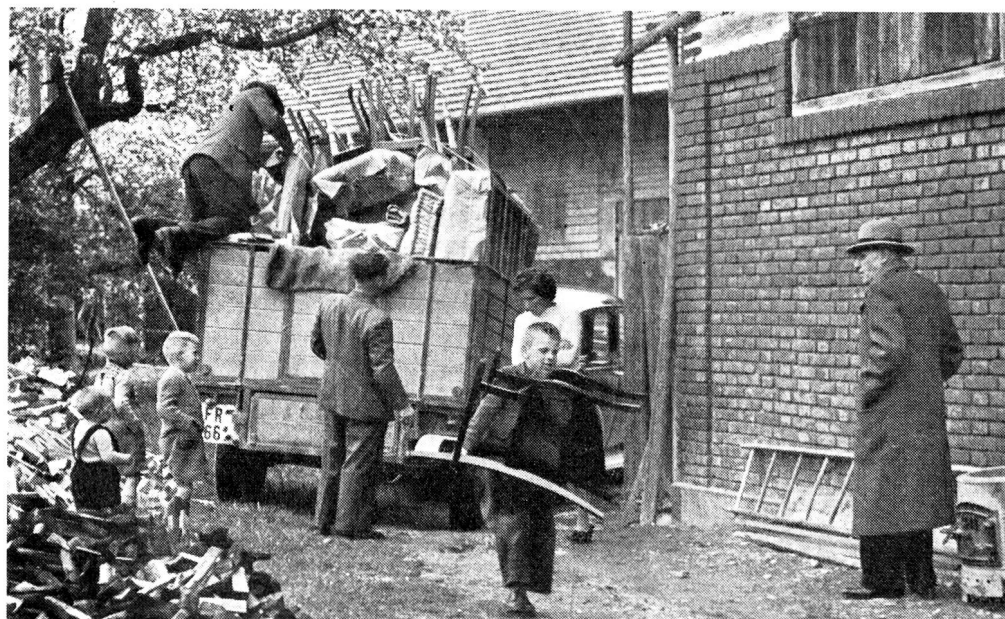
Celle-ci met à disposition le mobilier et la literie indispensables aux sinistrés qui ont tout perdu. Un voisin prête sa camionnette, le mobilier peut être remis aux sinistrés par la Croix-Rouge fribourgeoise. Les aînés des huit enfants aident au déchargement.

La section croix-rouge de Porrentruy s'est réorganisée et a complété son comité au début de l'an dernier. Elle a fourni un gros effort également en faveur des réfugiés hongrois — deux prises de sang collectives,