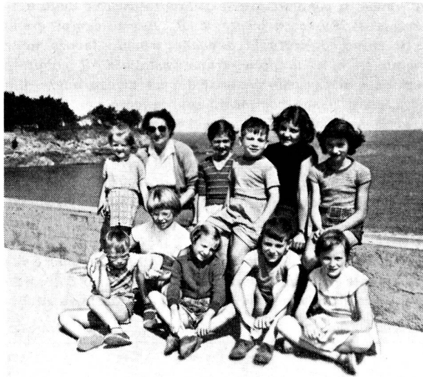
Un groupe d'enfants de Martigny à la colonie de vacances de Rotheneuf près de St-Malo.

Particolarmente interessante l'azione iniziata per raggruppare in una Federazione tutte le opere di assistenza sociale esistenti nel bellinzonese, azione partita