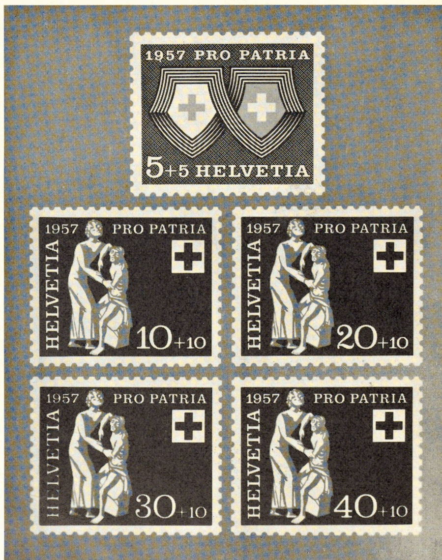
Les timbres « Pro Patria » viennent d'être émis.