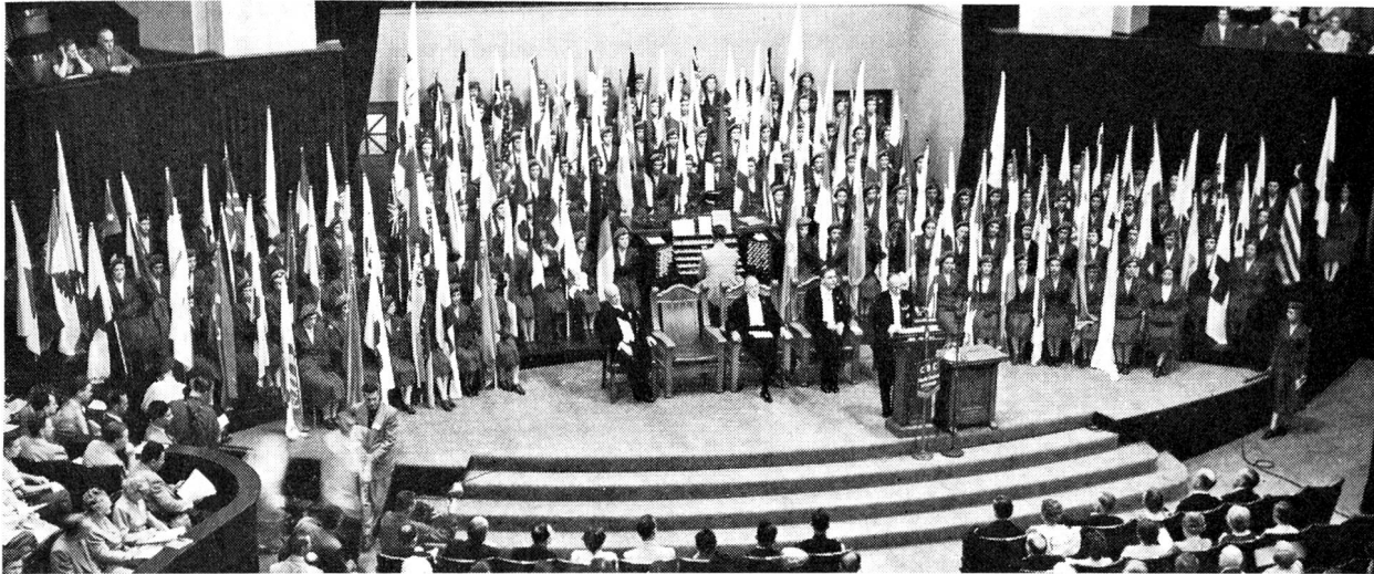
L'ouverture solennelle de la XVIII e Conférence internationale de la Croix-Rouge à Toronto en 1952.