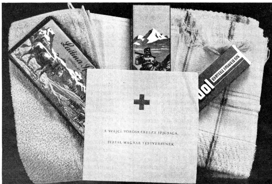
Un des 1400 sacs cadeaux offerts par les « juniors » suisses aux enfants de Budapest.

La Croix-Rouge néerlandaise a offert à la Croix-Rouge suisse, par l'intermédiaire de la Ligue des sociétés de la Croix-Rouge, 8000 exemplaires d'un petit dictionnaire en huit langues destiné aux réfugiés hongrois vivant dans notre pays. Il peut être obtenu aux adresses suivantes, gratuitement: Entraide ouvrière, Quellenstrasse 31, Zurich 5; Caritas-Centrale, Löwenstrasse 3, Lucerne; Entraide protestante, Stampfenbachstrasse 121, Zurich; Office central d'aide aux réfugiés, Jenatschstrasse 6, Zurich; Croix-Rouge suisse, Taubenstrasse 8, Berne.