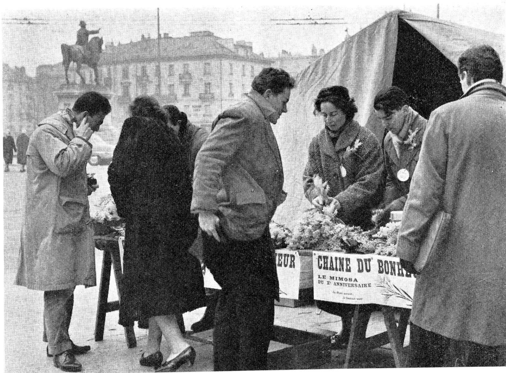
Mimosa 1959... Mimosa des enfants.

La Chaîne du Bonheur a fait le tour du monde Sa ronde recommence sans se lasser jamais, Alors que sa voix claire retentit sur les ondes « Papous » hâtons-nous donc de fleurir nos chalets.