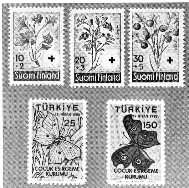
En haut les trois valeurs finlandaises, en bas deux des valeurs émises par la Turquie annoncées dans notre précédente édition.