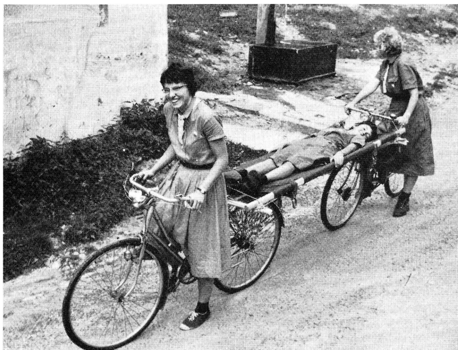
Transport de brancard à bicyclette

C'est au retour seulement, que les campeuses apprirent qu'elles venaient de subir sans s'en douter l'épreuve de la spécialité d'éclaireuse croix-rouge. Avec un plein succès, puisque, sur le rapport des jurés et des experts, l'insigne spécial d'éclaireuse croix-rouge était attribué aux huit cheftaines de louveteaux et aux vingt-trois guides et éclaireuses présentes. Une seule ombre au tableau, le modèle de l'insigne de cette nouvelle spécialité inscrite au programme de la Fédération des éclaireuses suisses n'est pas encore fixé. Mais il le sera sous