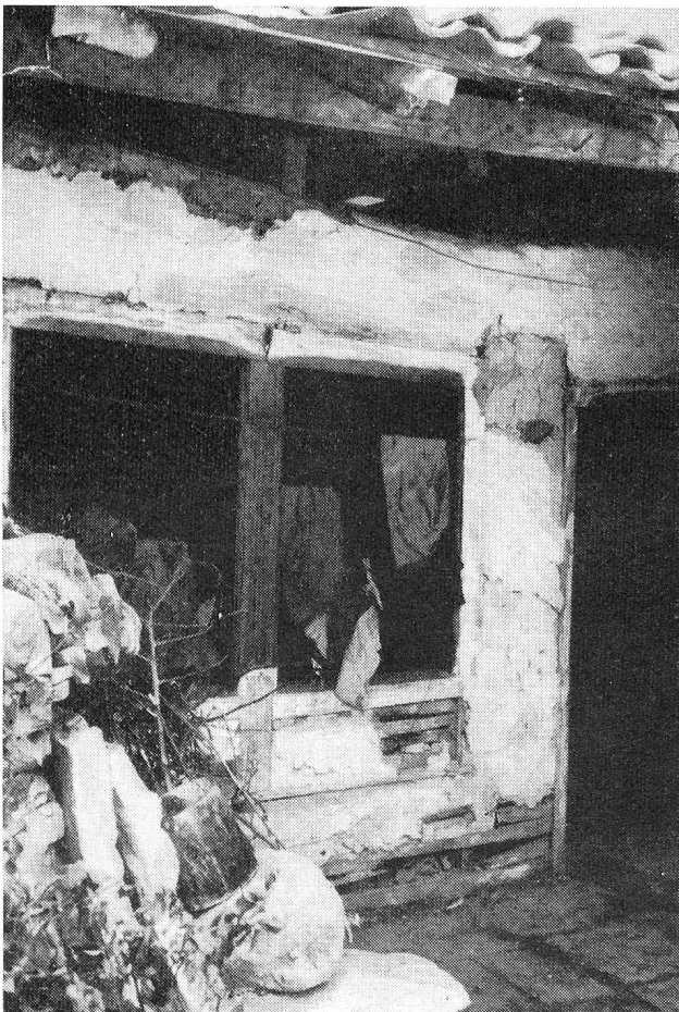
Une mesure parmi des milliers d'autres...

Il faut se baisser pour pénétrer à l'intérieur des masures, se baisser pour en sortir. C'est ainsi qu'en relevant la tête nous avons aperçu l'Acropole et le Parthénon, se dressant ivres de lumière, de grandeur, tandis qu'à nos pieds gisait toute la misère humaine réunie entre des murs de torchis et des sentiers de