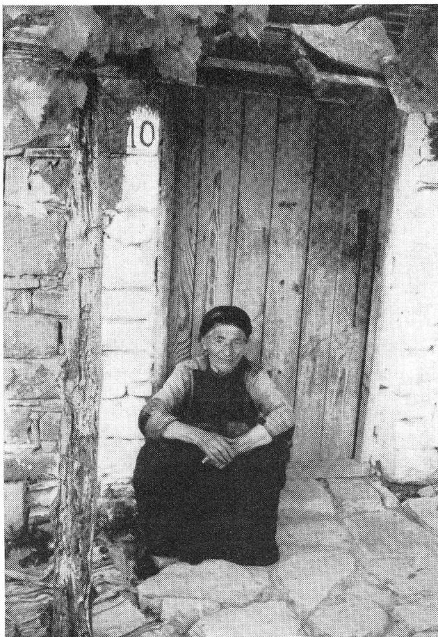
On l'appelle « la Bohémienne »

Alors c'est ainsi. Pendant qu'il se trouvait en Grèce est survenu le crack d'Amérique. Le père Georges a perdu toutes ses économies, ses économies de dix-neuf