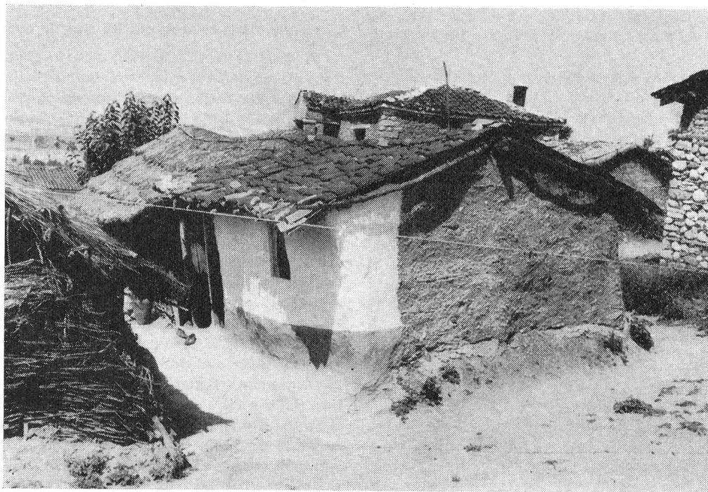
Quelque part en Grèce...

La vieille Yiayia, comme on appelle toutes les vieilles par ici, s'assied par terre, à la turque, à nos genoux: