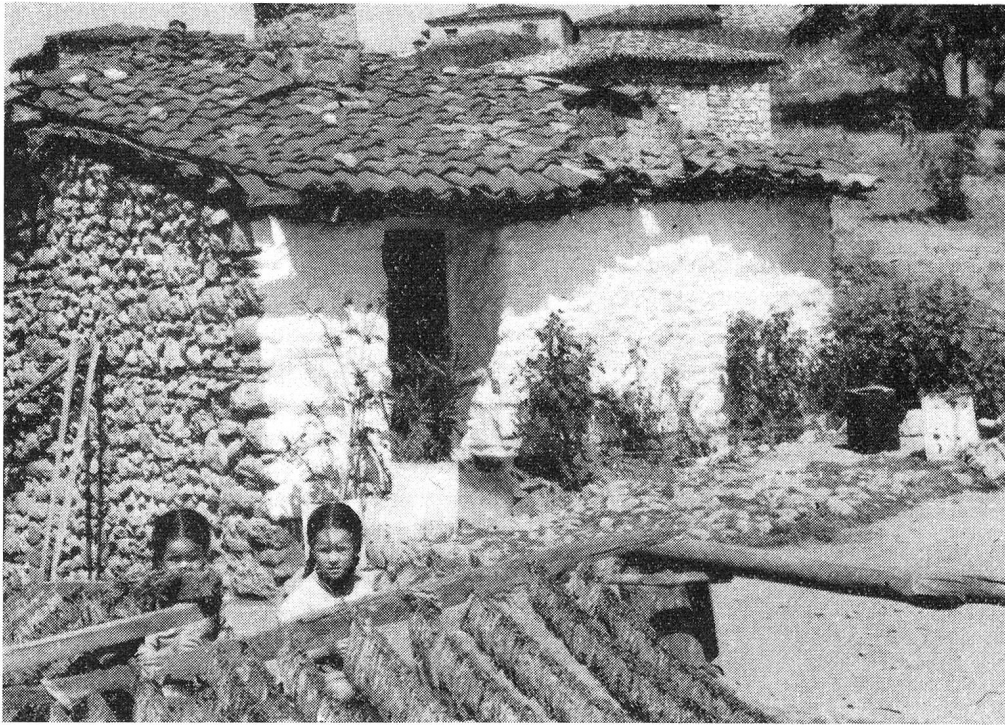
Tout le jour, les enfants piquent les feuilles de tabac sur de longs fils...

Nous longeons l'ancienne voie sacrée qui mène à Eleusis et qu'empruntaient jadis les pèlerins se rendant aux Mystères. Voici le lac où ils se purifiaient avant d'arriver aux lieux saints. A quelques kilomètres, se dressent aujourd'hui les cheminées de la raffinerie de pétrole d'Eleusis, qui n'est plus qu'une bourgade industrielle. De la plus haute s'échappe une flamme, étrange flambeau qui brûle jour et nuit. Et nous quittons la