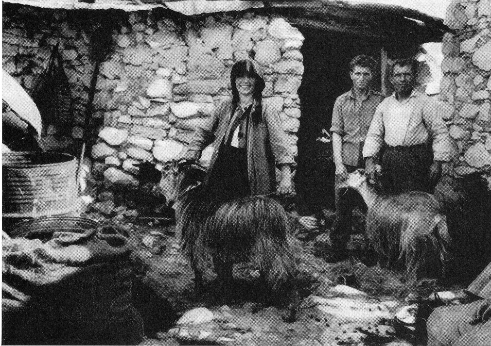
Deux chèvres, c'est-à-dire du lait et de la laine