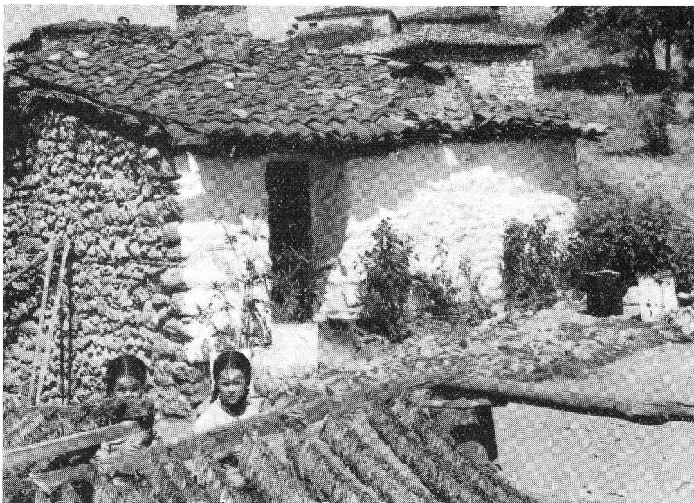
Tout le jour, les enfants piquent les feuilles de tabac sur de longs fils...

Nous longeons l'ancienne voie sacrée qui mène à Eleusis et qu'empruntaient jadis les pèlerins se rendant aux Mystères. Voici le lac où ils se purifiaient avant d'arriver aux lieux saints. A quelques kilomètres, se dressent aujourd'hui les cheminées de la raffinerie de pétrole d'Eleusis, qui n'est plus qu'une bourgade industrielle. De la plus haute s'échappe une flamme, étrange flambeau qui brûle jour et nuit. Et nous quittons la