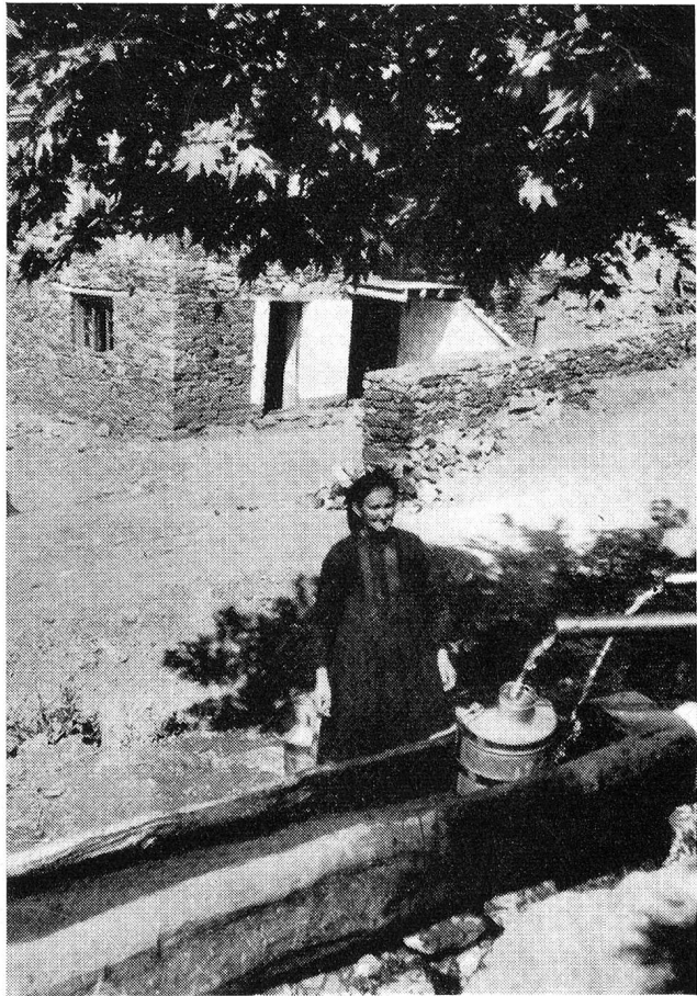
L'eau, ce trésor précieux

Les enfants ne jouent pas, dans les villages de Macédoine. Tout le jour, lorsqu'ils ne vont pas à l'école, ils gardent les bêtes, ou piquent les feuilles de tabac sur de longs fils.