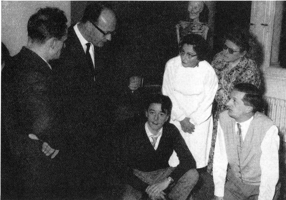
Corso militi della Croce Rossa Locarno. — Il medico istruttore controlla e consiglia

Al Direttore dunque spetteranno in futuro altri e più vasti compiti, poichè l'Ospedale distrettuale di Faido