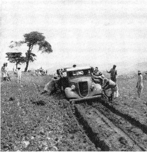
En Ethiopie, sur les pistes...

est grièvement blessé et que sa vie dépend d'un transport rapide à Addis-Abeba. Je montre les saufs-conduits de l'empereur et sa lettre personnelle.