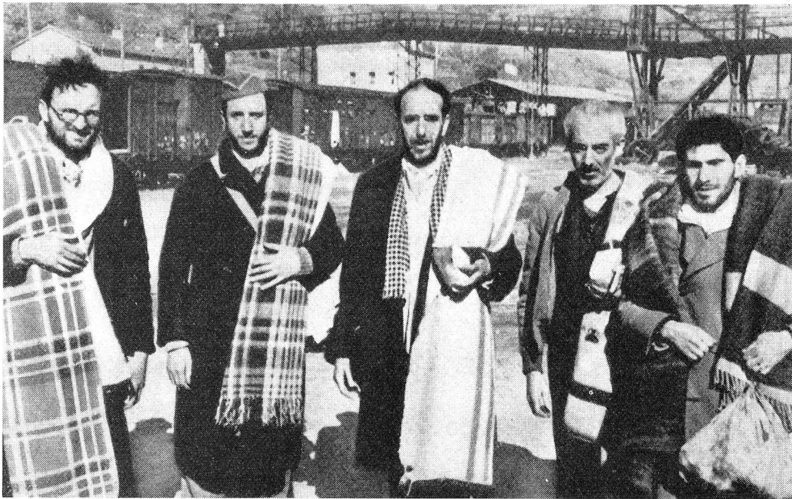
Guerre d'Espagne. Des fugitifs ont été accueillis par des délégués du C. I. C. R.