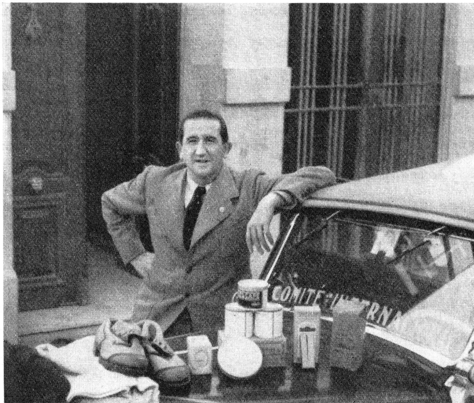
En mission à Gandia 1938

Mais, plus que jamais, cet esprit dont je sais maintenant ce qu'il peut faire, ce qu'il peut obtenir quand aucun droit ne parle pour un homme qui souffre et qui n'appartient plus au monde que par sa souffrance et son dénuement.