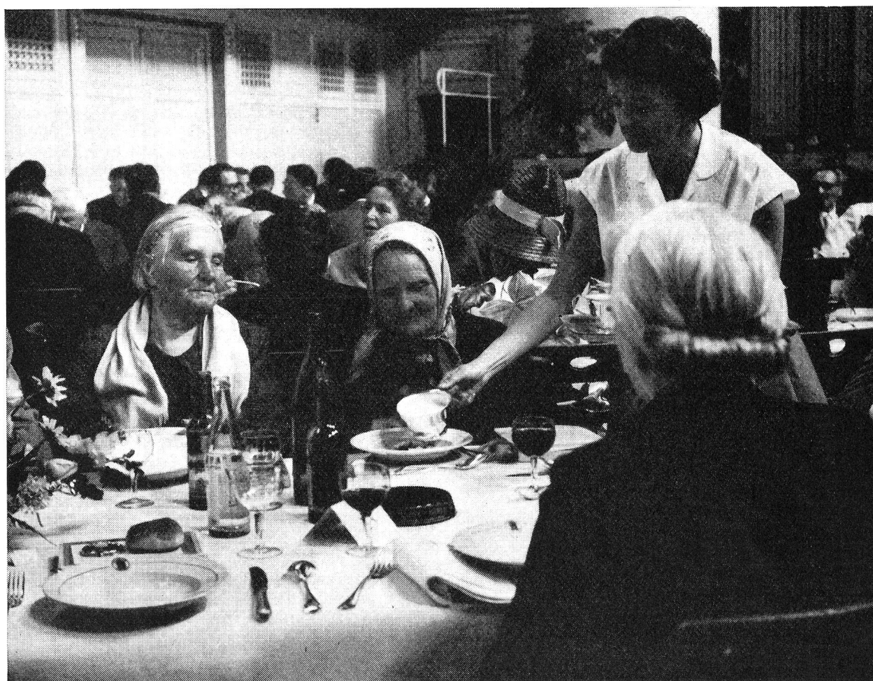
La «journée suisse» des réfugiés

Rappelons que l'initiative dite « hard-core », dont le but est d'octroyer un droit d'asile permanent à des « personnes déplacées » qui se voient refuser toute