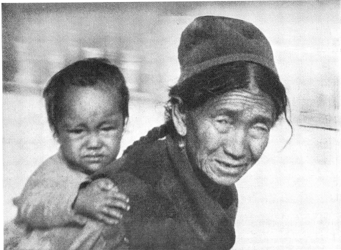
Un enfant tibétain et sa mère. A droite, le premier avion de la Croix-Rouge internationale, un Pilatus, a été piloté par le pilote suisse Hermann Schreyber sur la piste qui a été créée à son intention par des soldats suisses et des réfugiés à Mingbo dans le Khumbu, à 4700 mètres d'altitude.