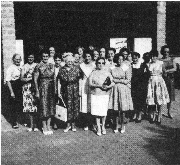
Rossa (Calanca), settembre 1961

Ci vollero alcuni anni, e la prima conoscenza rudimentale del dialetto, per chiarire il mistero: infatti la popolazione incontrando il medico gli diceva, certo con