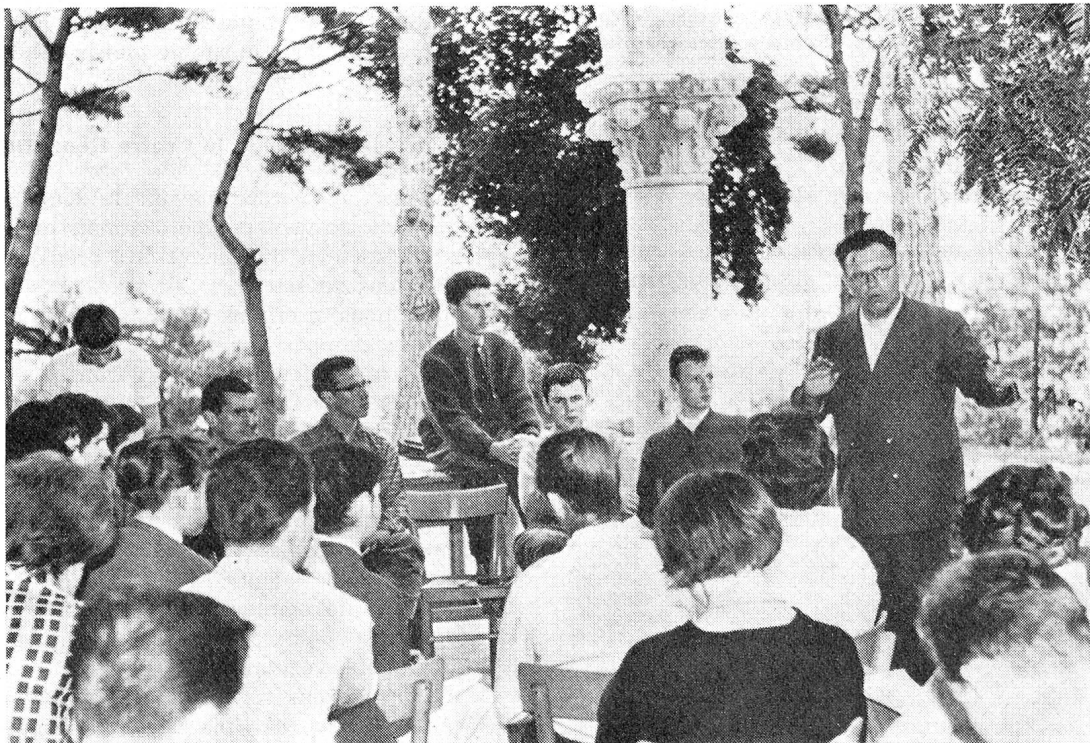
Le chant, la musique remplissent d'autres heures... Une trentaine de jeunes de Suisse allemande ont pris part au dernier cours qui a eu lieu à Varazze du 7 au 14 octobre