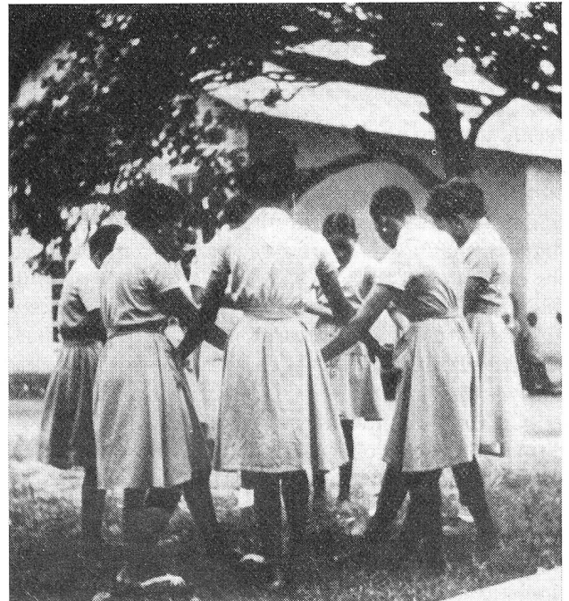
Des jeunes filles elles aussi travaillent dans les groupes de la Croix-Rouge congolaise de la jeunesse