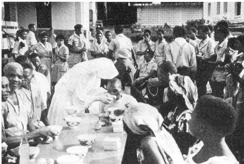
Biscuits de soldats et chocolat suisse, un goûter de Noël qui fait beaucoup d'heureux

— Eh! bien, les enfants des hôpitaux et de la léproserie ont eu Noël quand même. Avec la permission du chef de notre mission, j'ai pu mettre à disposition de la Croix-Rouge de la