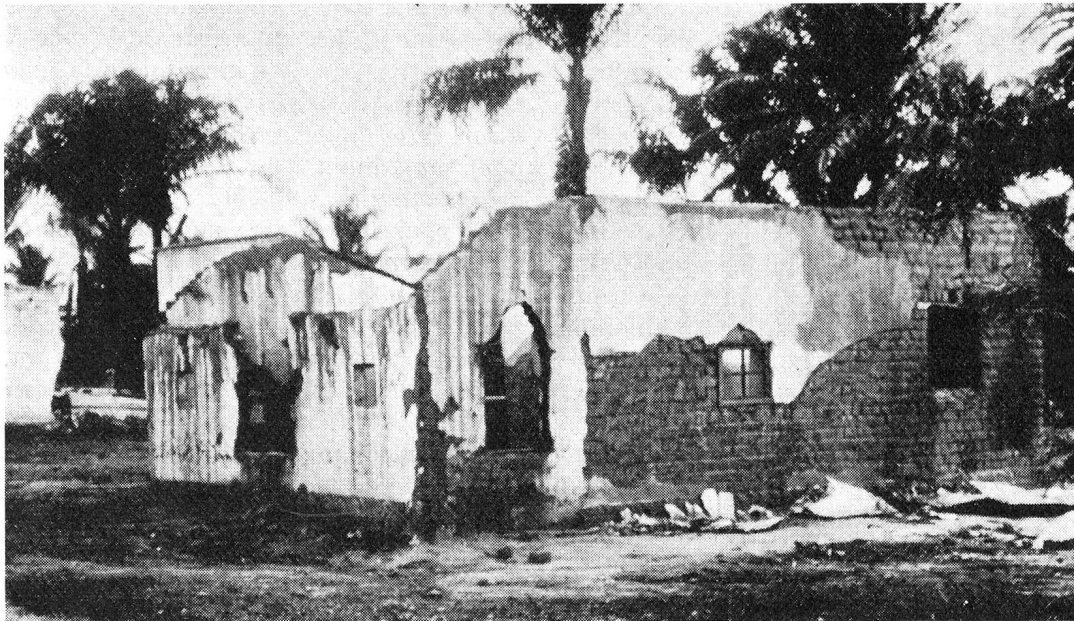
Dans bien des régions, des maisons incendiées disent l'âpreté de la guerre des tribus

Son travail d'administrateur de l'Unité suisse ne se bornait pas à l'hôpital de Kintambo, à Léopoldville, elle s'étendait accessoirement à celui de Katanga, également, où notre Unité a été appelée à détacher quelques-uns de ses membres pour y soigner des malades et y instruire du personnel indigène, ainsi qu'au Dépôt central médi-