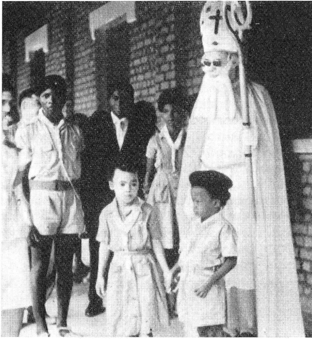
Et Saint-Nicolas ne manque pas à la fête

laise de la Croix-Rouge. Il eut souvent l'occasion de lui prêter son concours, d'organiser des causeries pour elle et de leur parler, à leur demande, de notre propre pays et de ses institutions. Un point entre autres semblait les intéresser, les plus grands surtout, celui de l'organisation de la Suisse.