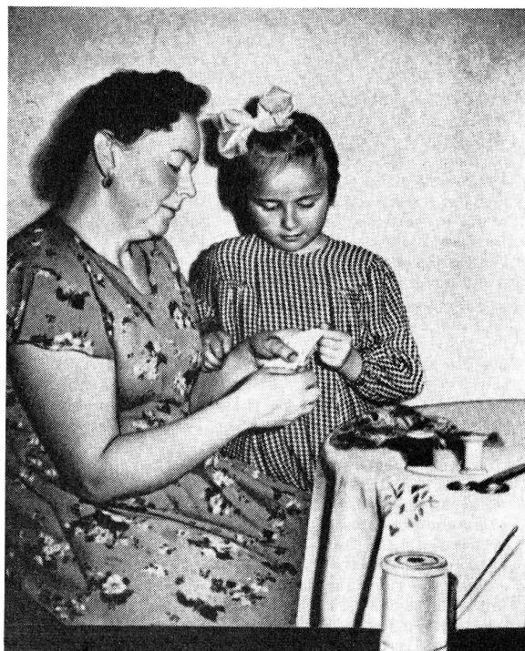
Prenez garde aux yeux des enfants. — Laisser une aiguille plantée ainsi dans une bobine est dangereux! Un faux mouvement, un faux pas et l'œil de votre enfant peut être irrémédiablement perdu (Documentaire russe, cité par l'O.M.S.)

Balles de tennis, pelures de pastèques, fils d'acier, éclats de bois, chaux vive, plomb fondu, fouets, élastiques, épines, cornes de bétail, fusils à air comprimé et plombs de lignes de pêche.