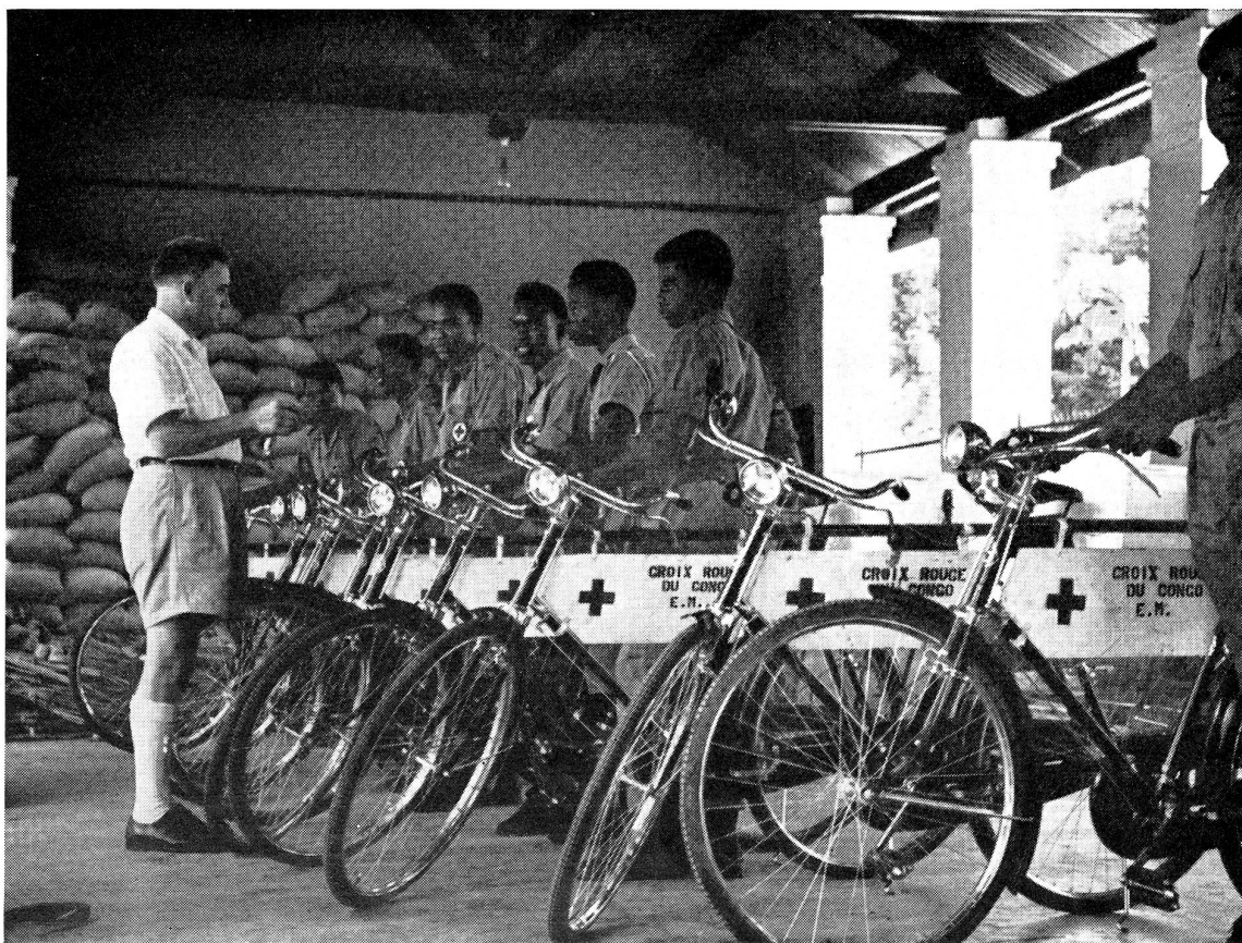
L'équipe mobile de vaccination antivariolique à Boma (Congo)

Tandis qu'à Kintambo 20 % seulement des varioleux meurent si l'on ne tient pas compte des 5 % des cas qui y entrent moribonds et qui y meurent avant même qu'on puisse les soigner. En effet, bien que l'on ne